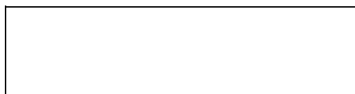
Схема границы балансовой принадлежности

е) границей эксплуатационной ответственности объектов централизованной системы холодного водоснабжения организации водопроводно-канализационного хозяйства и заказчика является: